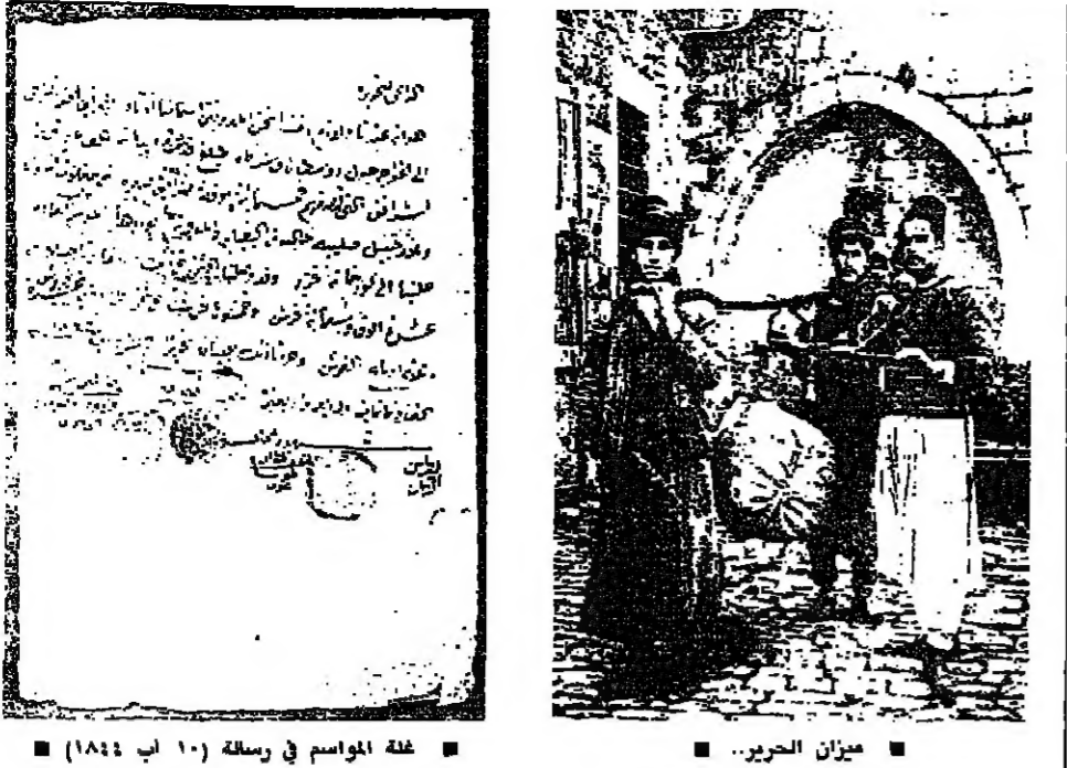
ميدان الحرير... غلة الموسم في رسمة (١٠ آب ١٩٨٤)